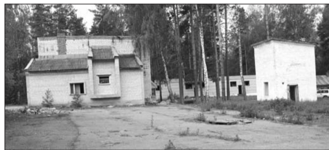
Забор – и тот унесли!

Выгодно продал приватизированные обменные квартиры, которые ему давали как военному? Но официальные документы говорят о другом. Трёхкомнатную квартиру в Муроме