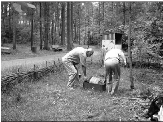
Сплели плетень – можно и о шашлычке подумать