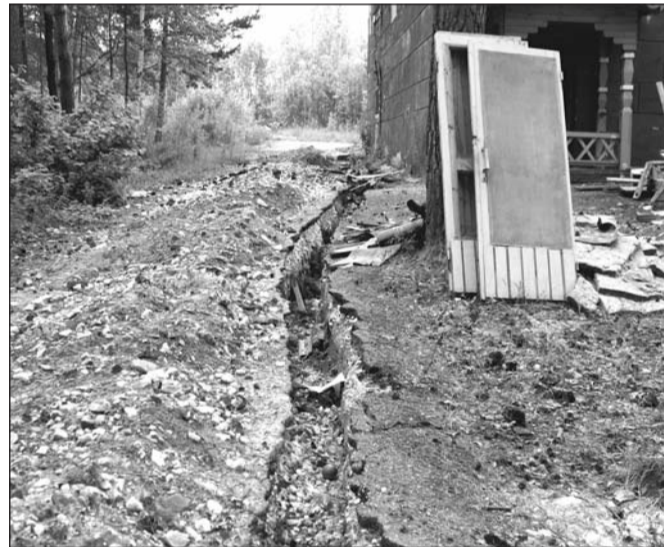
Даже кабель выкопали...