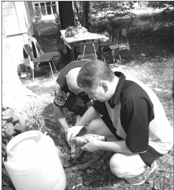
День рыбака – хороша будет ущица!