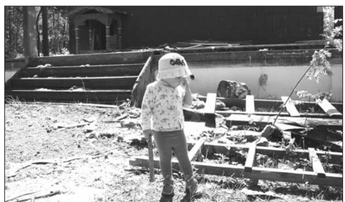
А где мы теперь будем отдыхать?!