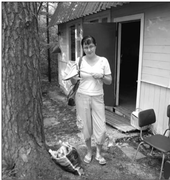
Уютный домик в лесу – что ещё нужно для хорошего отдыха?