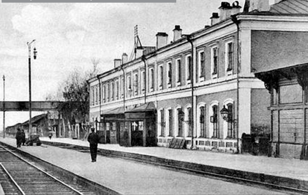
Открытка начала XX в. с изображением ковровского вокзала

ские. Они открылись в Коврове в 1864 г. и были самым крупным и передовым таким предприятием МПС в то время. Там построили первые отечественные пассажирские вагоны и затем опробовали многие технические новшества.