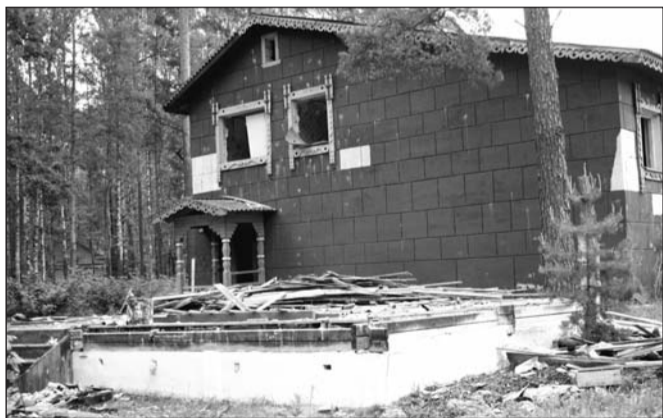
От «Теремка» остался лишь фундамент