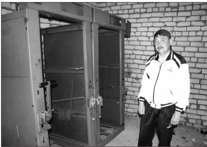
Все как корова языком слизала...