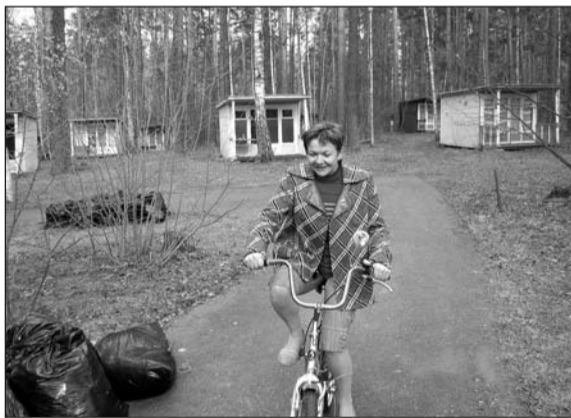
После уборки можно и отдохнуть (сзади домики, сейчас от них остался только пепел)